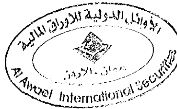
ضابط الامتثال روان شريم

- نسخة هيئة الأوراق المالية - نسخة بورصة عمان