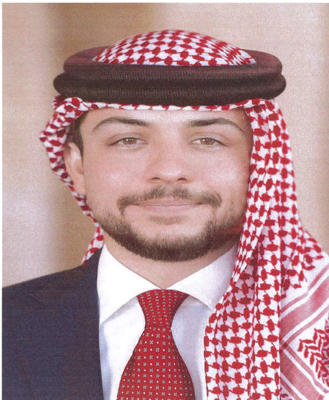
حضرة صاحب السمو الملكي الامير الحسين بن عبدالله الثاني المعظم ولي العهد