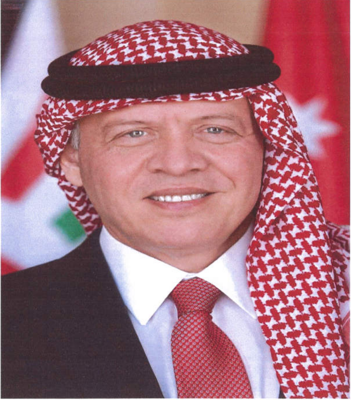
حضرة صاحب الجلالة الهاشمية الملك عبدالله الثاني بن الحسين المعظم