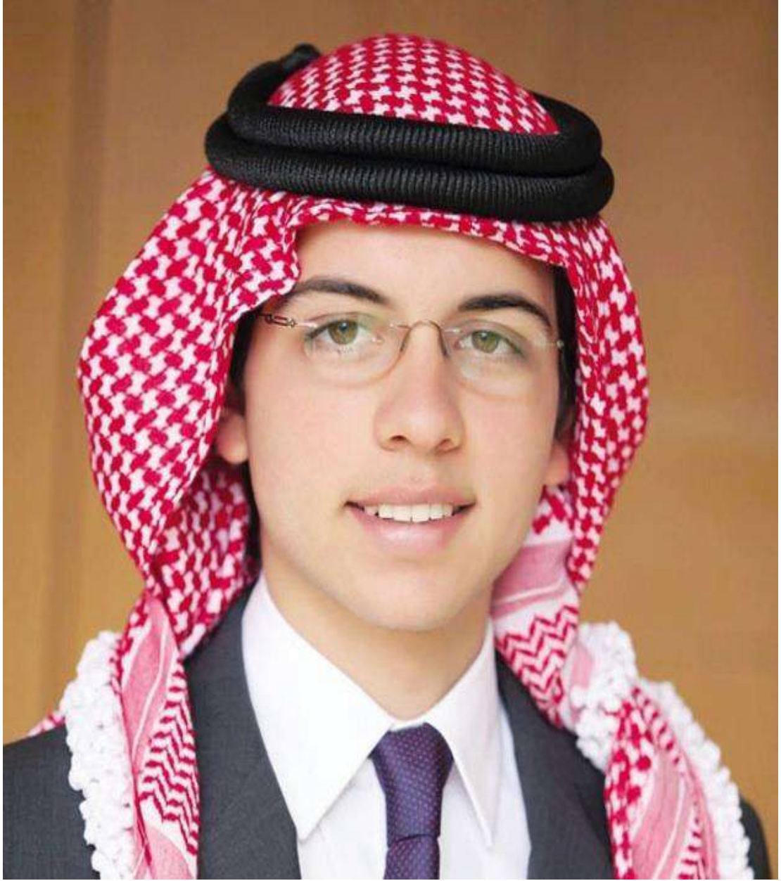
صاحب السمو الملكي الأمير الحسين ابن عبد الله الثاني ولي العهد المعظم