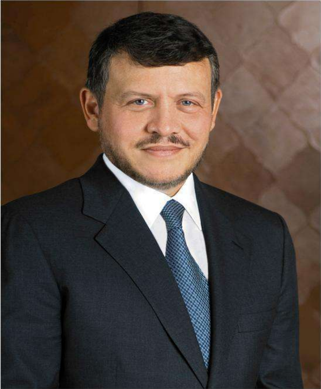
صاحب الجلالة الهاشمية الملك عبد الله الثاني ابن الحسين المعظم