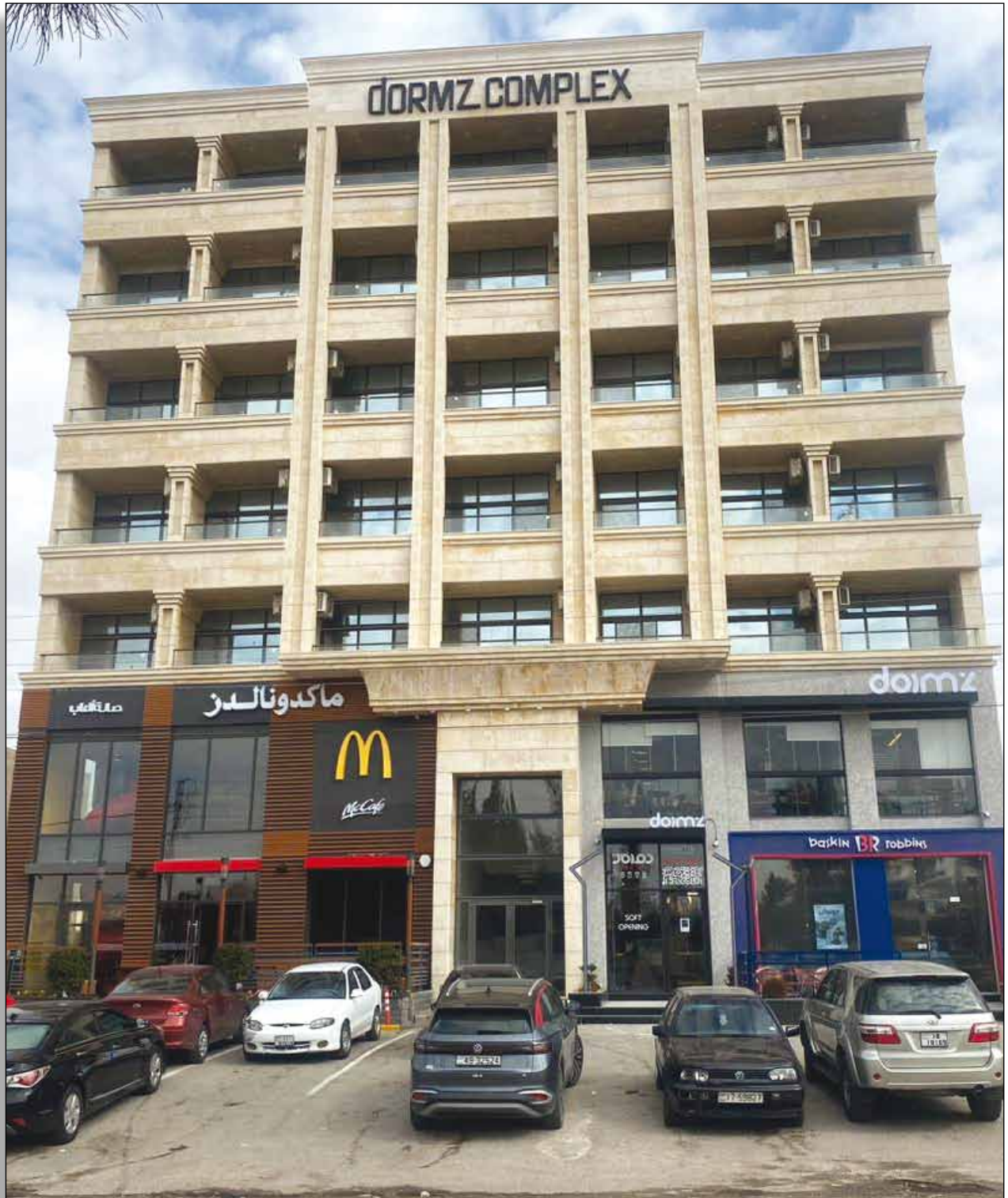
مجمع شركة هامن العقارية