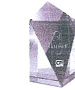
جائزة أفضل شركة تأجير تمويلي في الأردن لعام ٢٠١٦