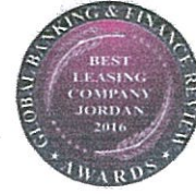
جائزة أفضل شركة تأجير تمويلي في الأردن لعام ٢٠١٦