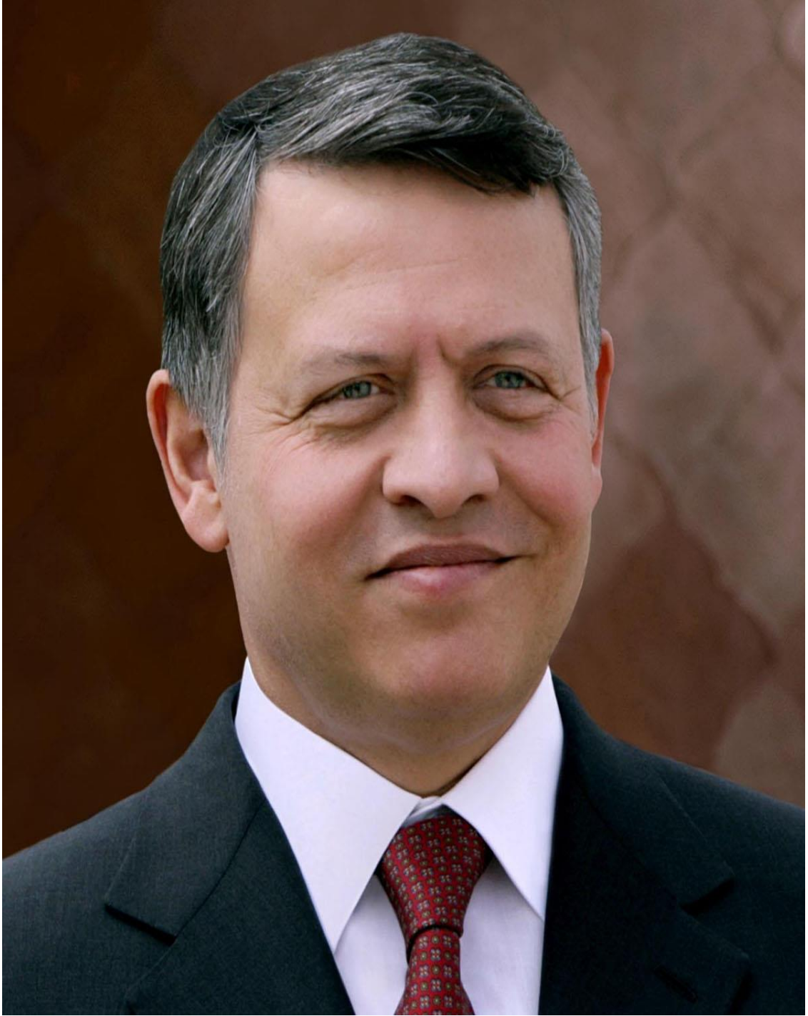
حضرة صاحب الجلالة الهاشمية الملك عبدالله الثاني بن الحسين المعظم (حفظه الله )