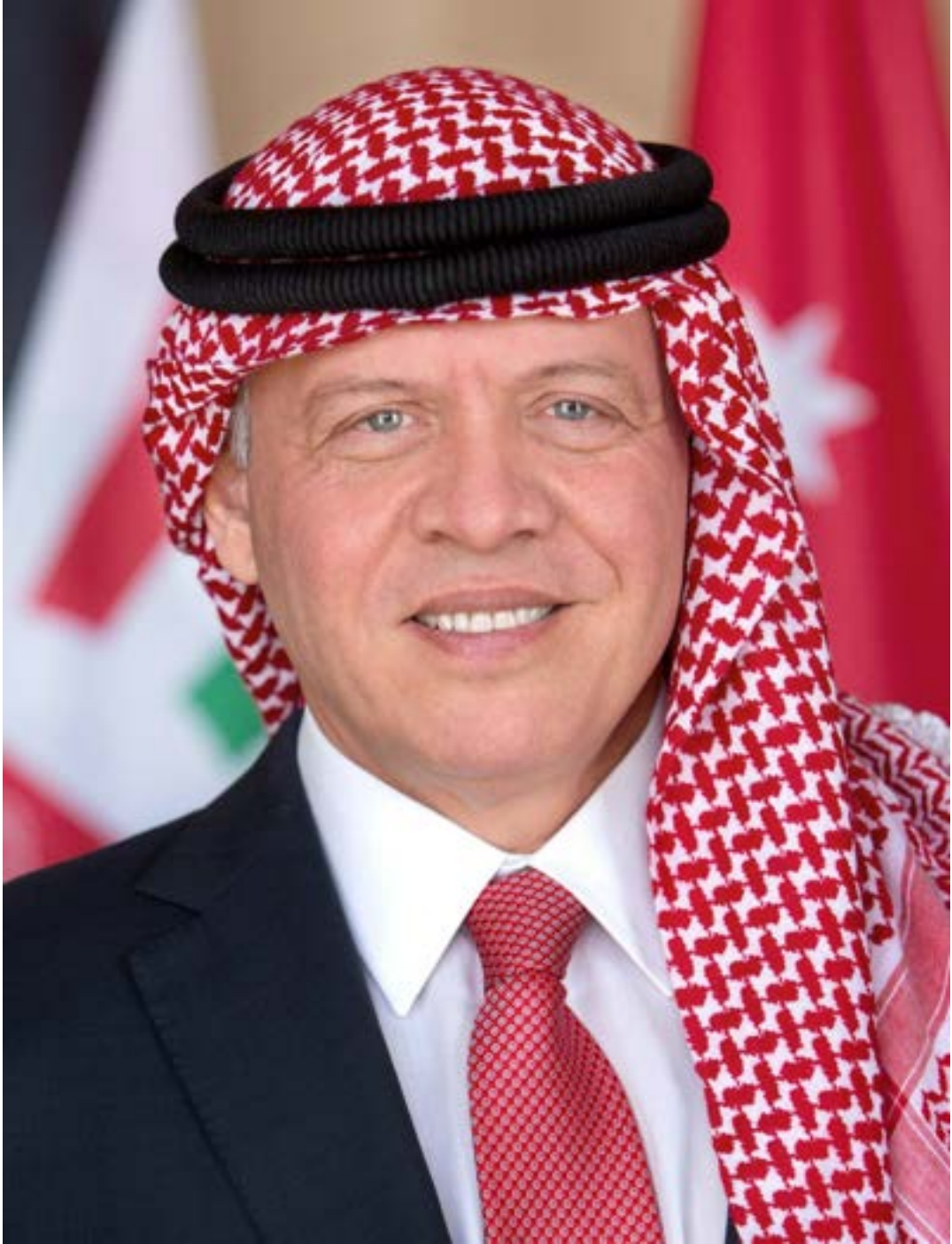
حضرة صاحب الجلالة الملك عبد الله الثاني ابن الحسين المعظم