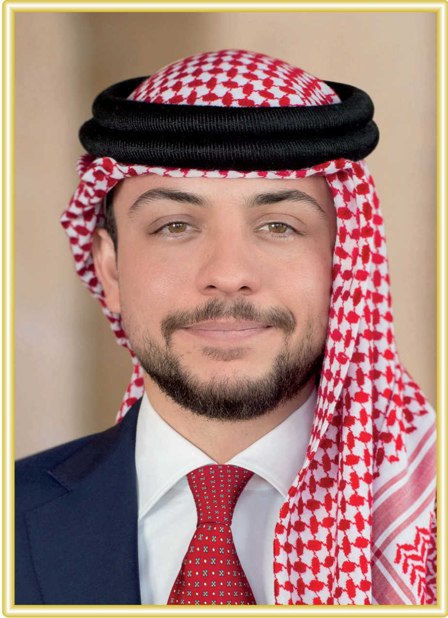
ولي العهد الأمير حسين ابن عبدالله الثاني