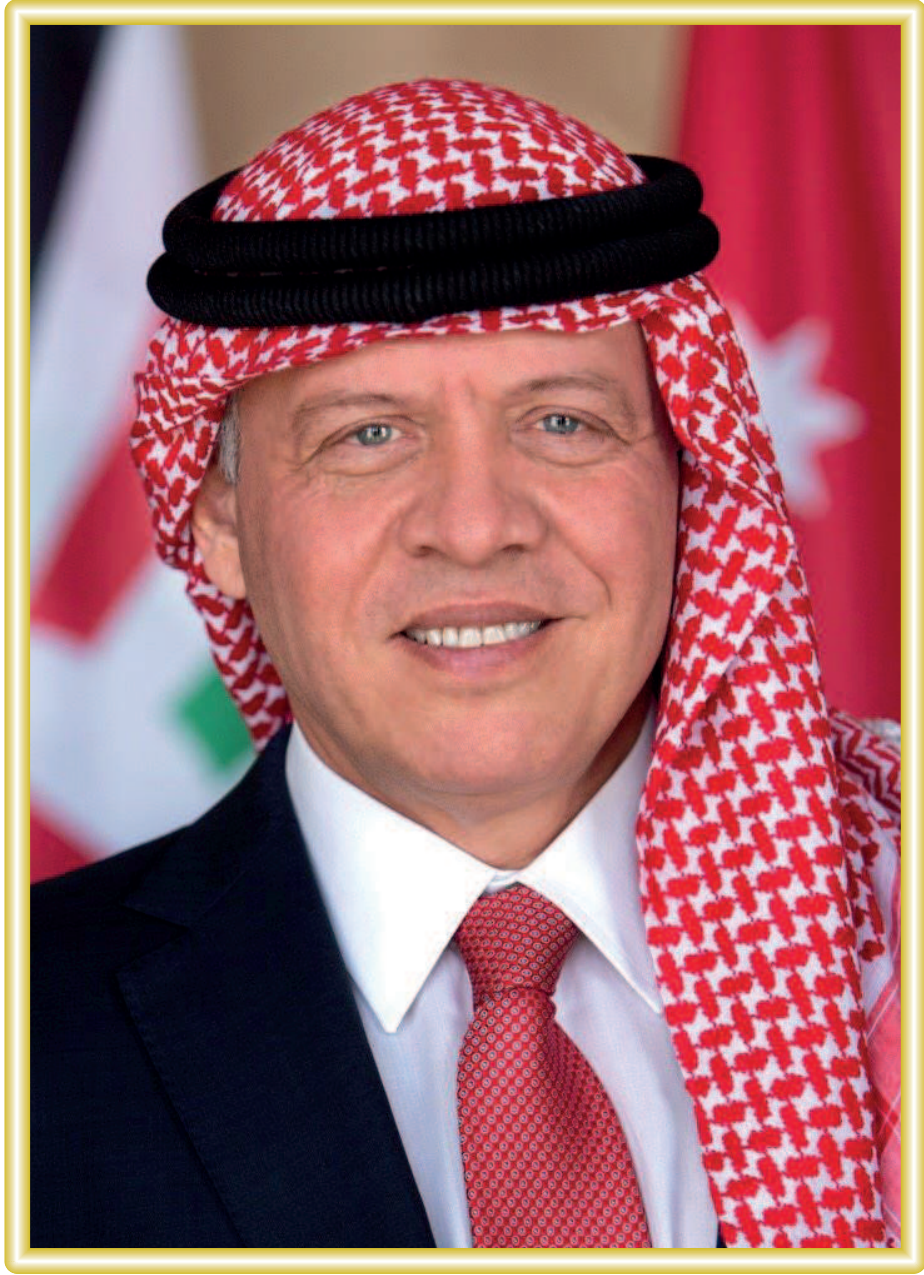
حضرة صاحب الجلالة الملك عبدالله الثاني ابن الحسين المعظم