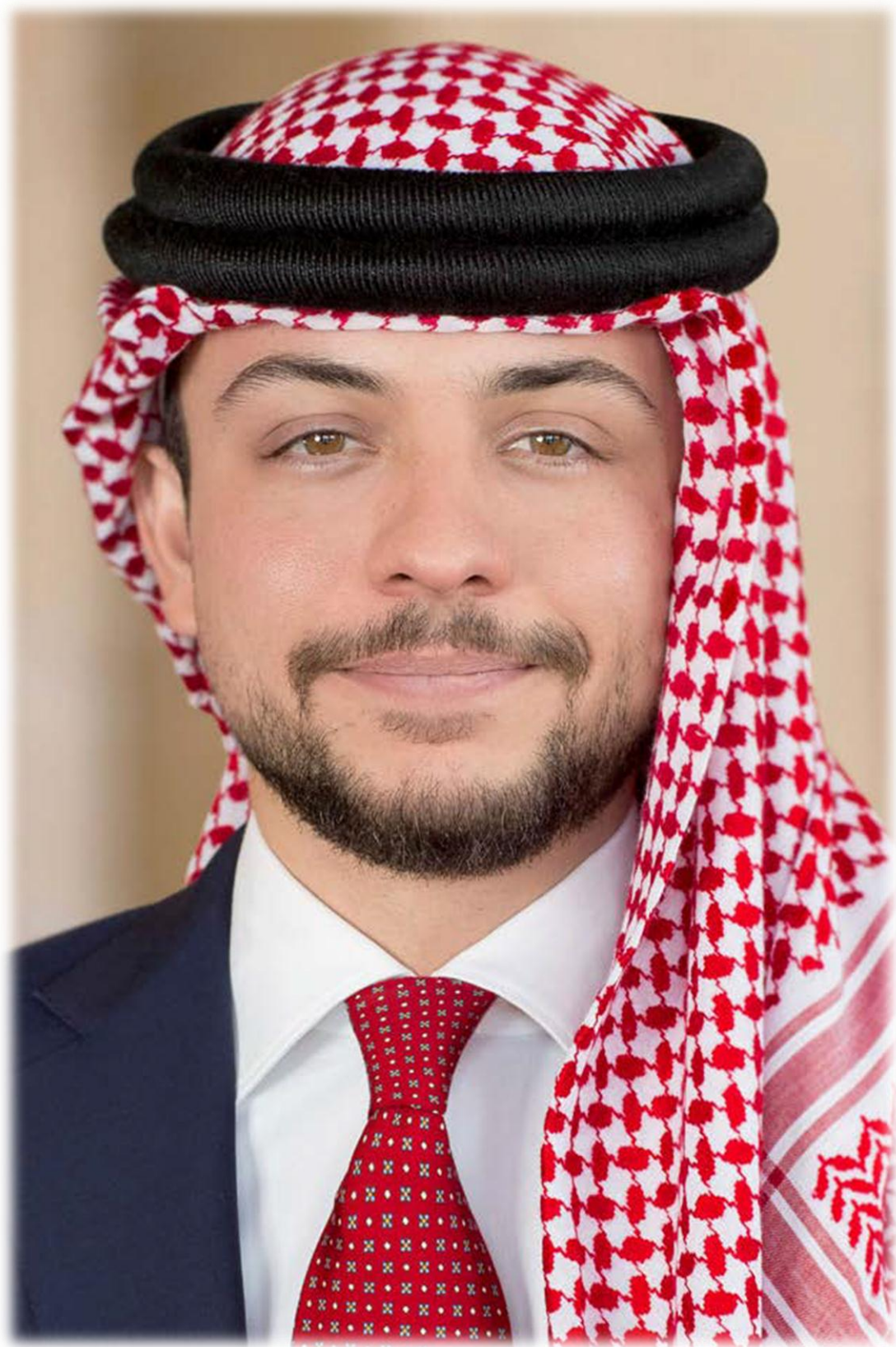
صاحب السمو الملكي الأمير الحسين بن عبدالله الثاني ولي العهد المعظم