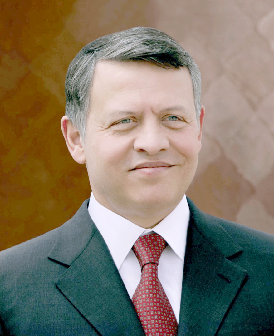
صاحب الجلالة الهاشمية الملك عبد الله الثاني ابن الحسين حفظه الله