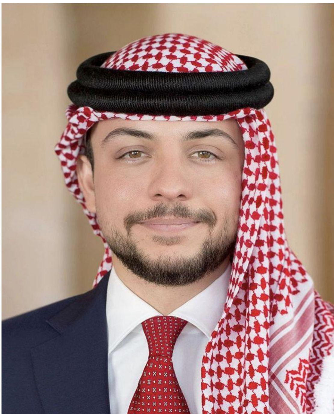
حضرة صاحب السمو الملكي ولي العهد الأمير الحسين بن عبد الله الثاني المعظم