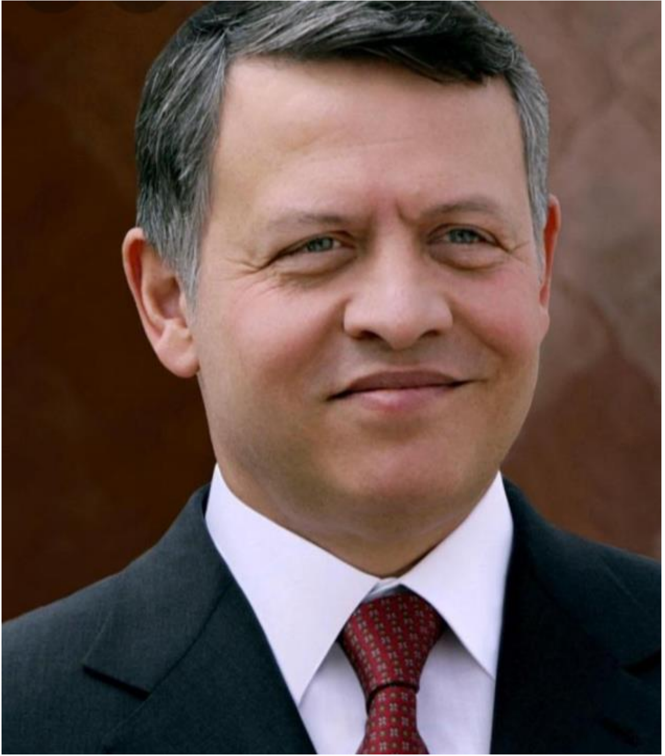
حضرة صاحب الجلالة الهاشمية الملك عبد الله الثاني بن الحسين المعظم