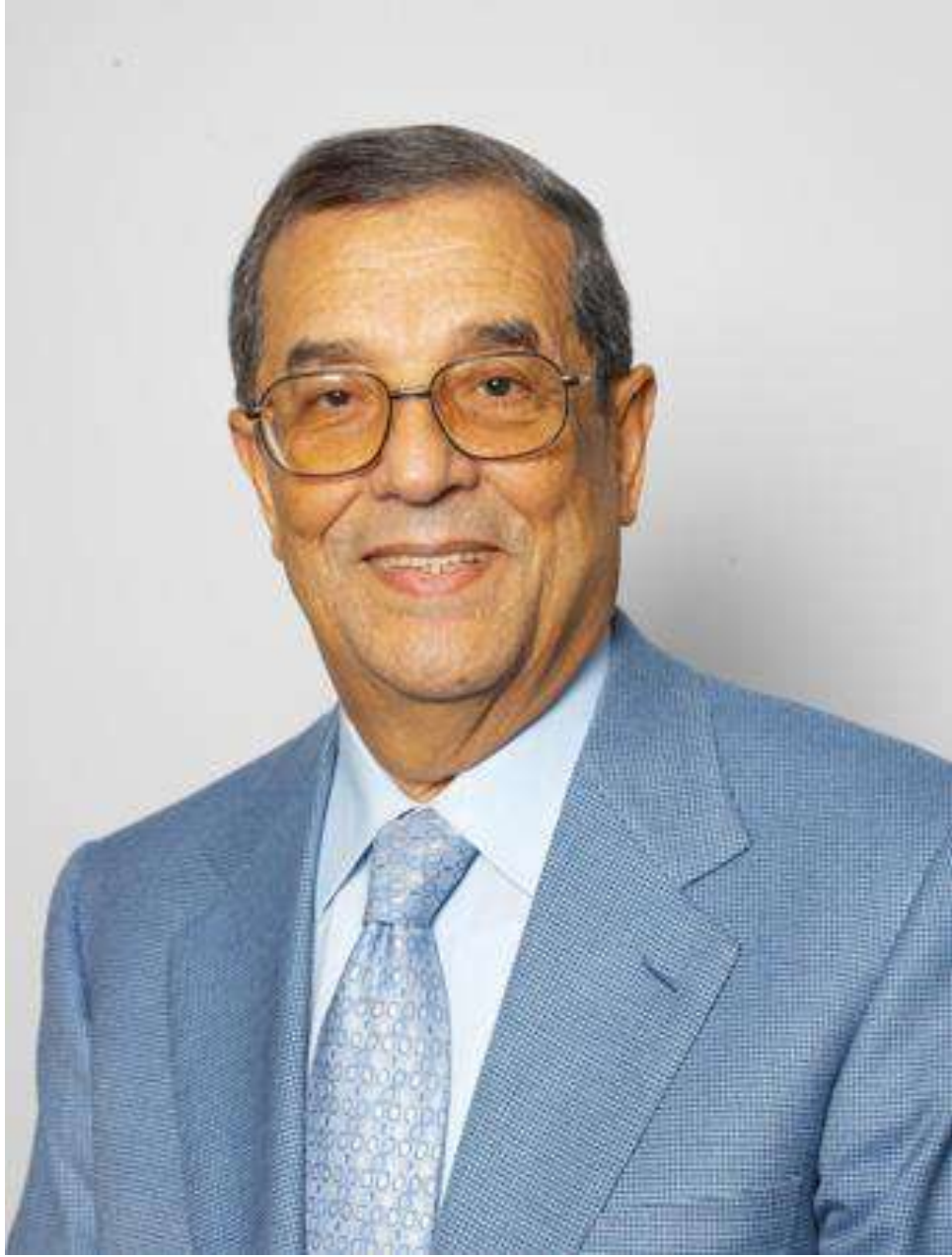
معالي المغفور له باذن الله الدكتور سميح طالب دروزه رائد الصناعة الدوائية في العالم العربي