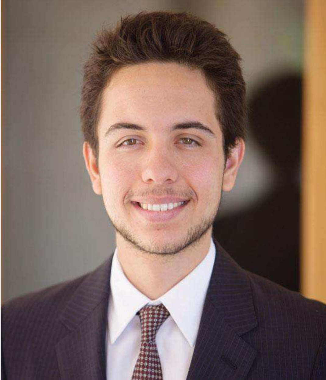
صاحب السمو الملكي الأمير الحسين بن عبدالله الثاني ولي العهد