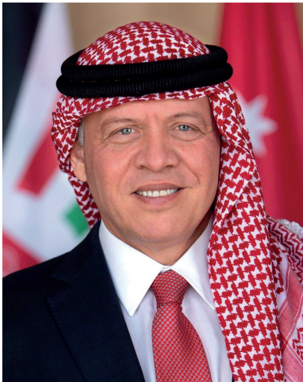
His majesty king Abdullah II Bin Al Hussein