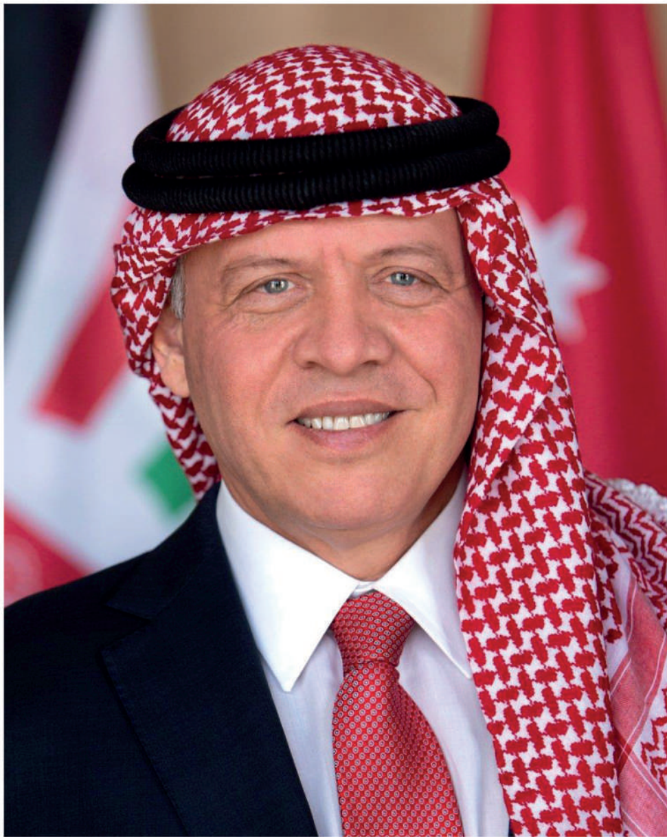
حضرة صاحب الجلالة الملك عبدالله الثاني بن الحسين المعظم