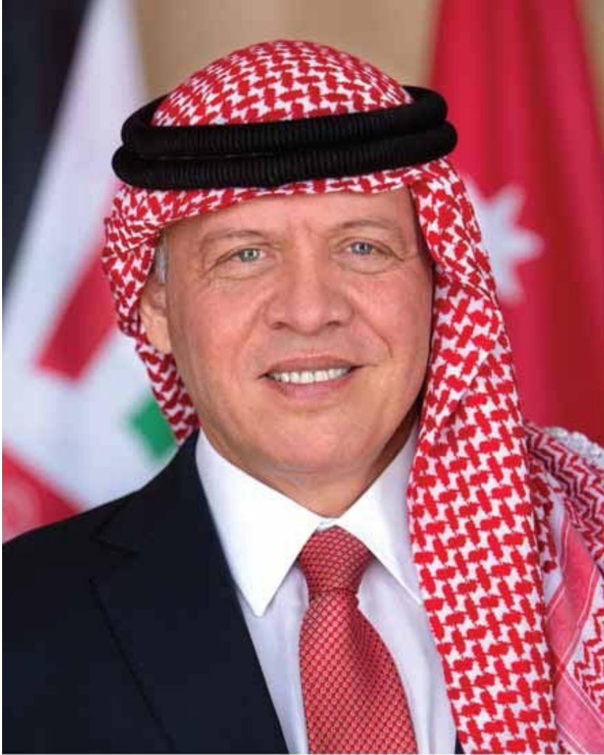
حضرة صاحب الجلالة الملك عبد الله الثاني بن الحسين المعظم