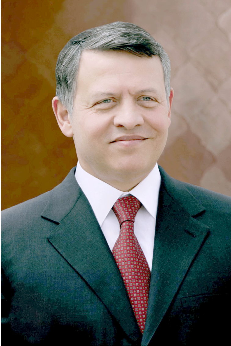
حضرة صاحب الجلالة الملك عبدالله الثاني بن الحسين المعظم