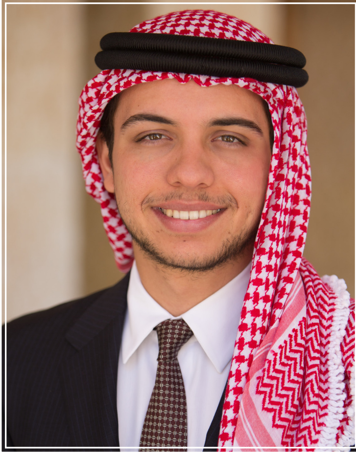
صاحب السمو الملكي الأمير الحسين بن عبدالله الثاني المعظم ولي العهد