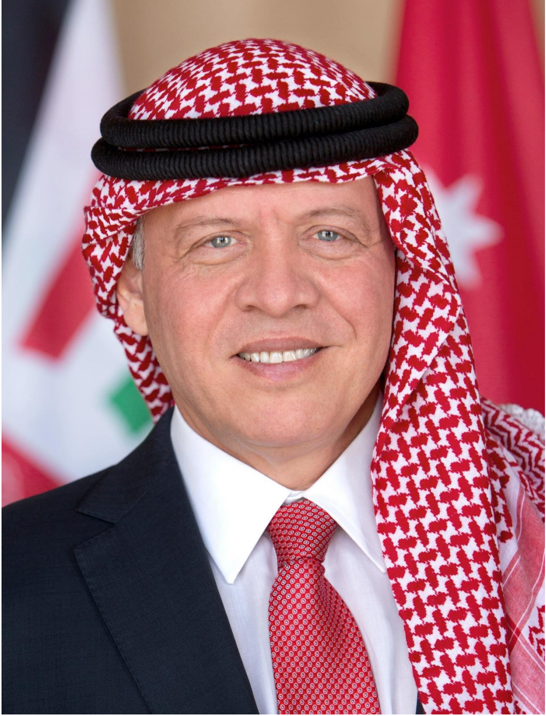
حضرة صاحب الجلالة الملك عبد الله الثاني ابن الحسين المعظم