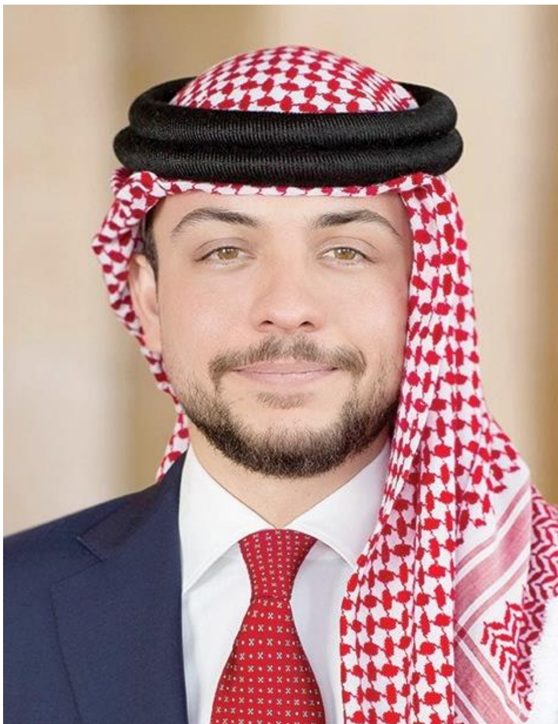
حضرة صاحب السمو الملكي الأمير الحسين بن عبد الله الثاني ولي العهد المعظم