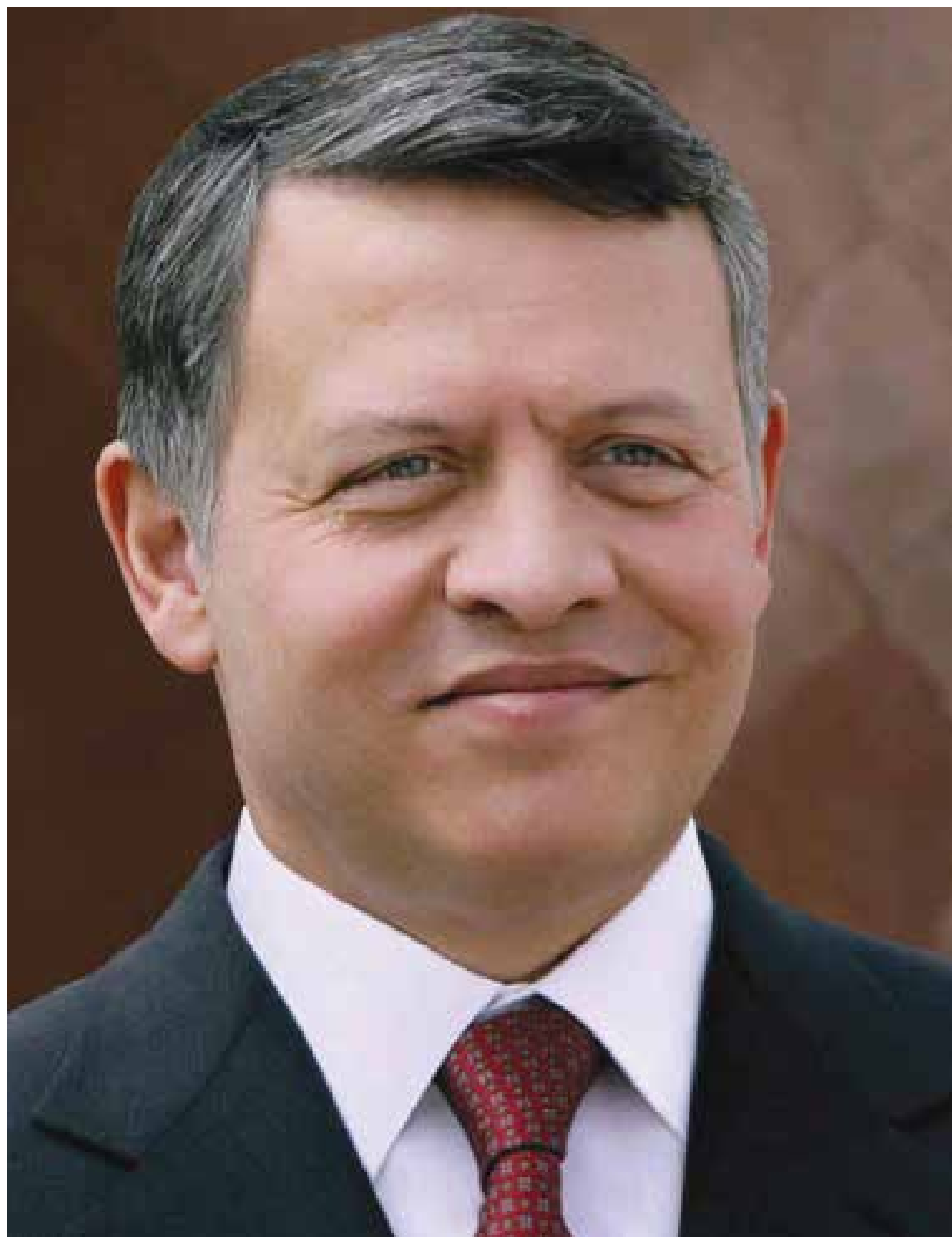
حضرة صاحب الجلالة الهاشمية الملك عبدالله الثاني بن الحسين المعظم