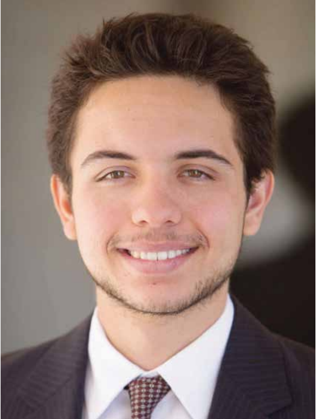
حضرة صاحب السمو الملكي الأمير حسين بن عبدالله ولي العهد المعظم