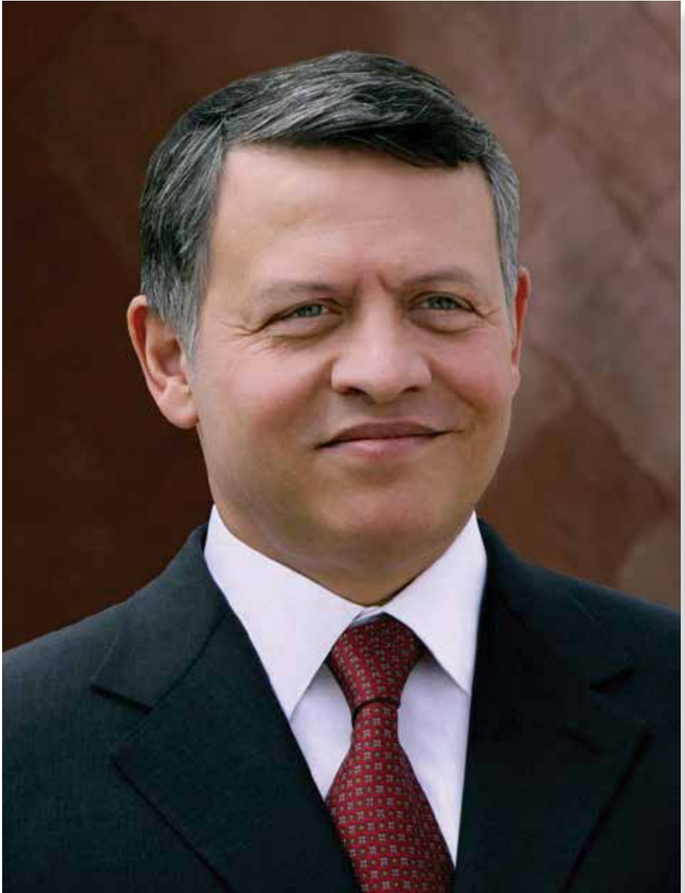
حضرة صاحب الجلالة الملك عبد الله الثاني بن الحسين المعظم