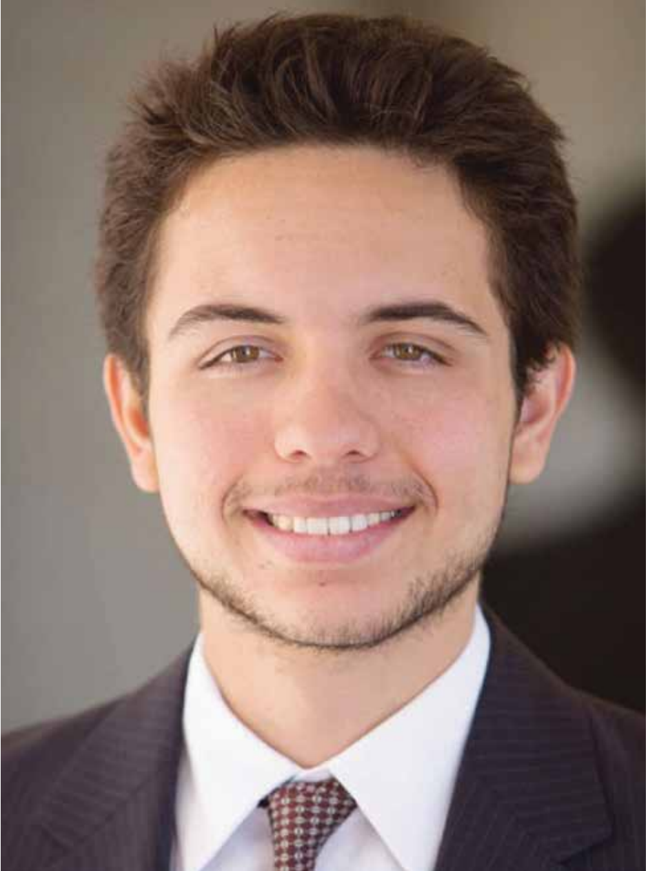
حضرة صاحب السمو الملكي الأمير الحسين بن عبد الله الثاني ولي العهد المعظم