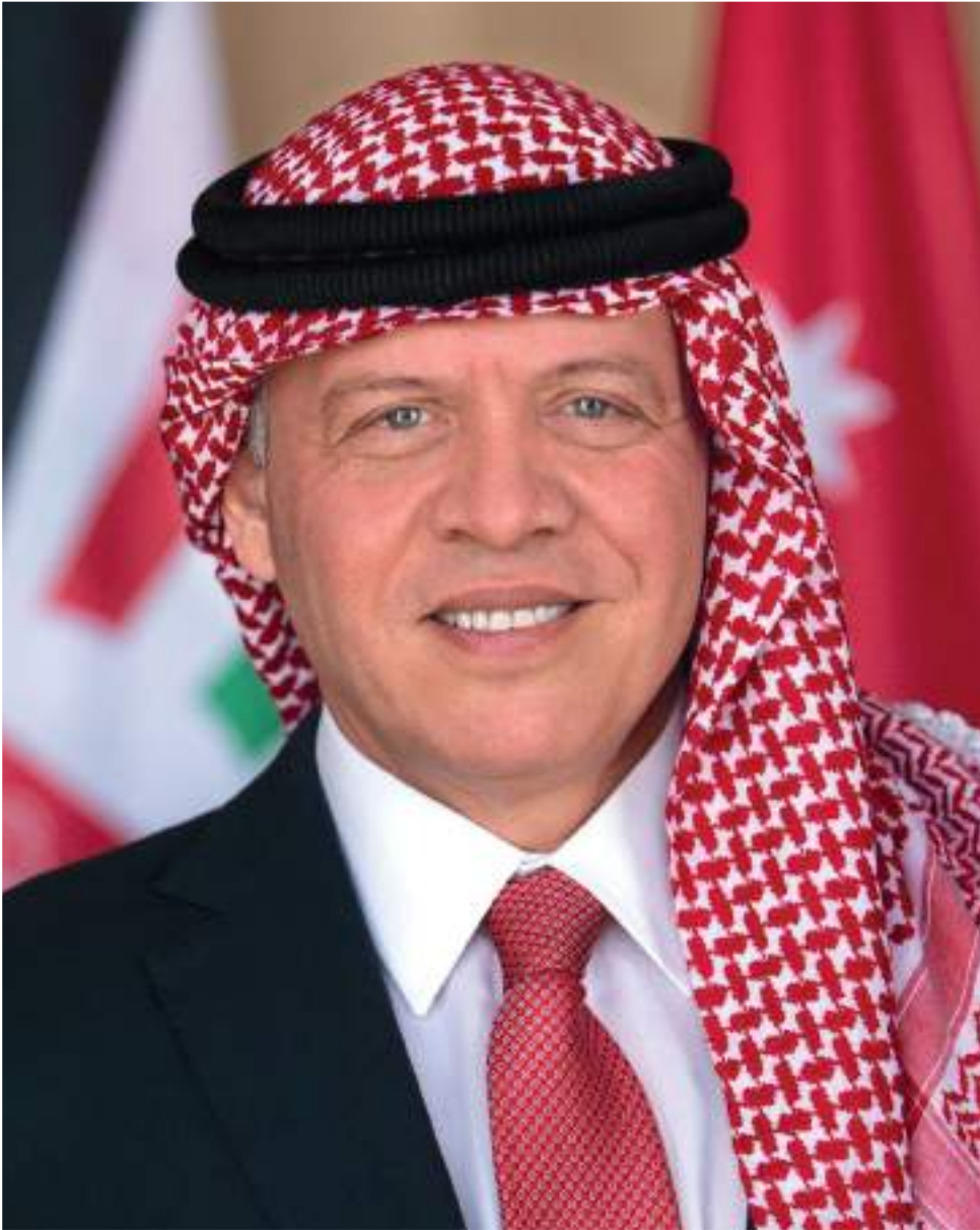
حضرة صاحب الجلالة الملك عبدالله الثاني بن الحسين المعظم