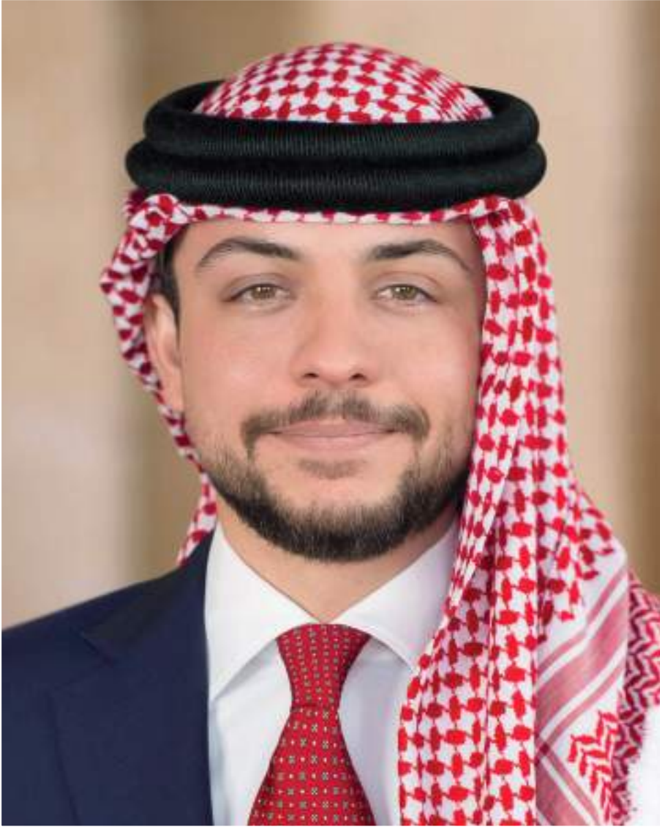
ولي العهد الامير حسين بن عبدالله الثاني