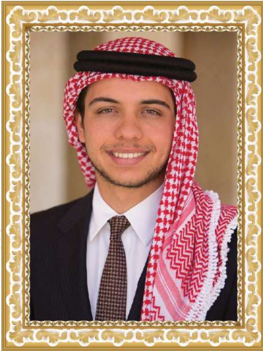
صاحب السمو الملكي الأمير الحسين بن عبدالله ولي العهد