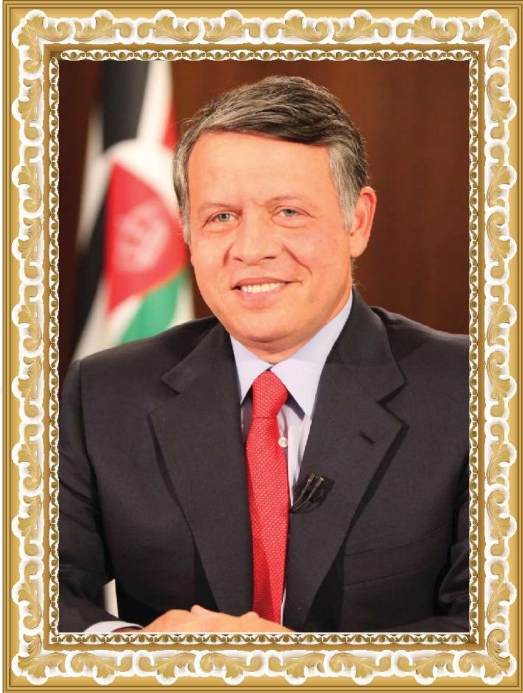
حضرة صاحب الجلالة الملك عبدالله بن الحسين المعظم