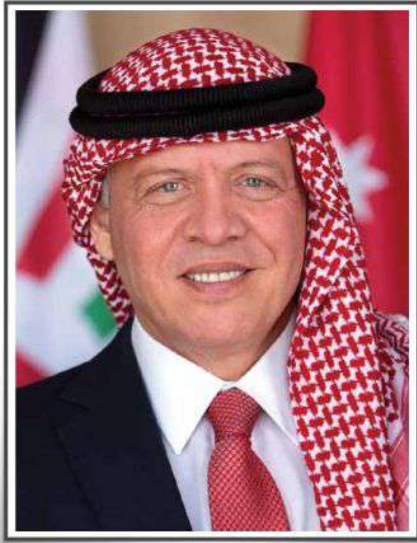
حضرة صاحب الجلالة الهاشمية الملك عبد الله الثاني ابن الحسين المعظم حفظه الله