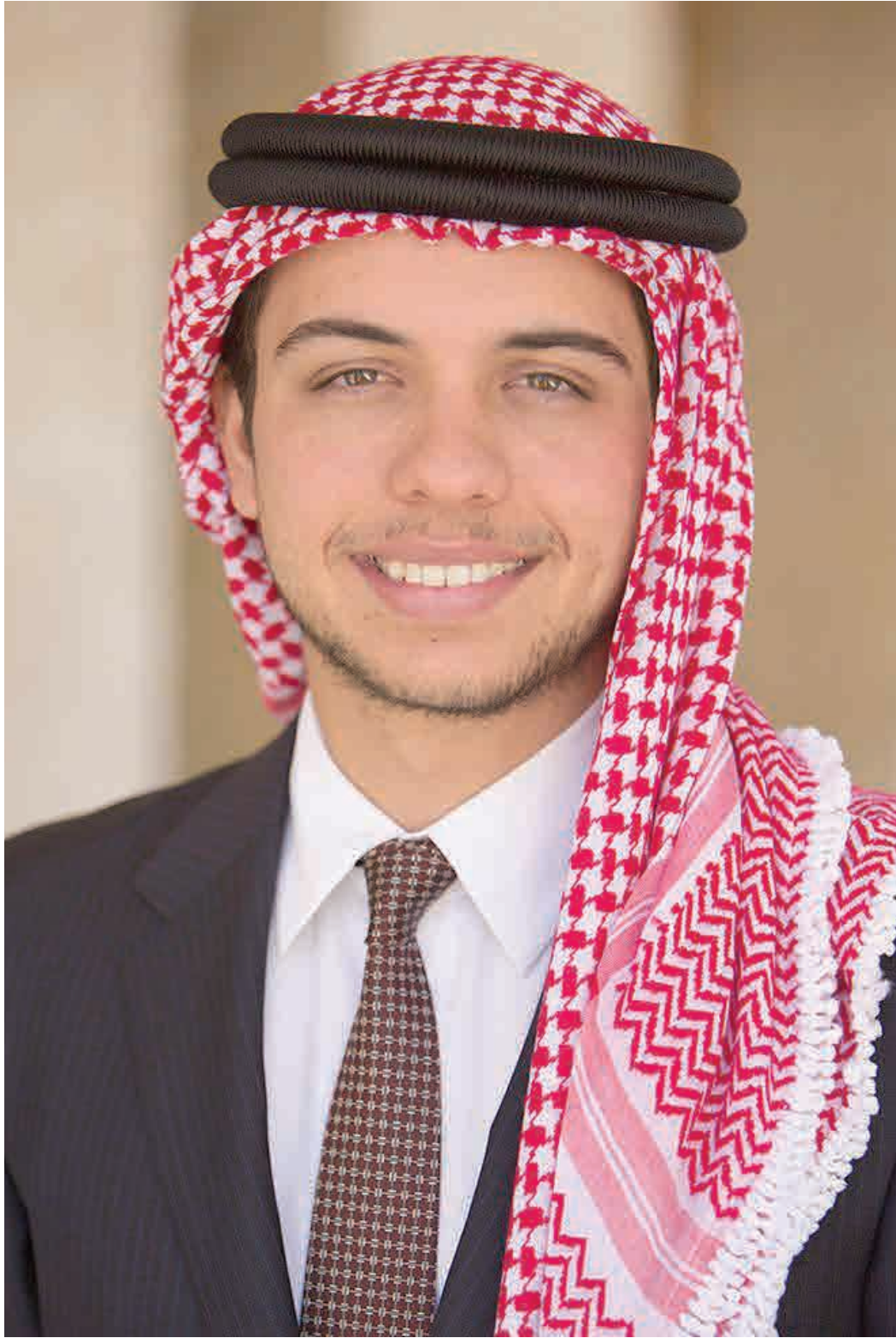
حضرة صاحب السمو ولي العهد الامير الحسين بن عبد الله الثاني المعظم حفظه الله ورعاه