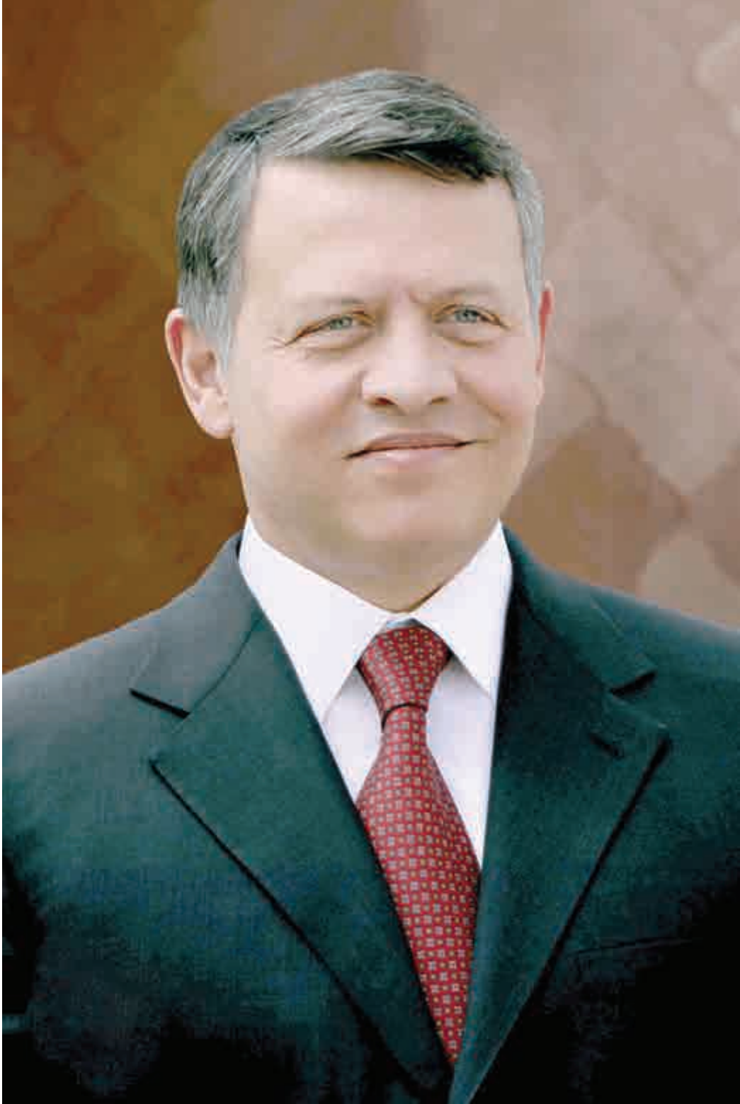
حضرة صاحب الجلالة الملك عبد الله الثاني بن الحسين حفظه الله ورعاه