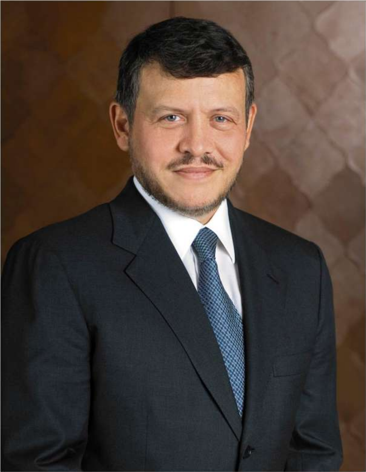
جلالة الملك عبد الله الثاني بن الحسين المعظم ملك المملكة الأردنية الهاشمية