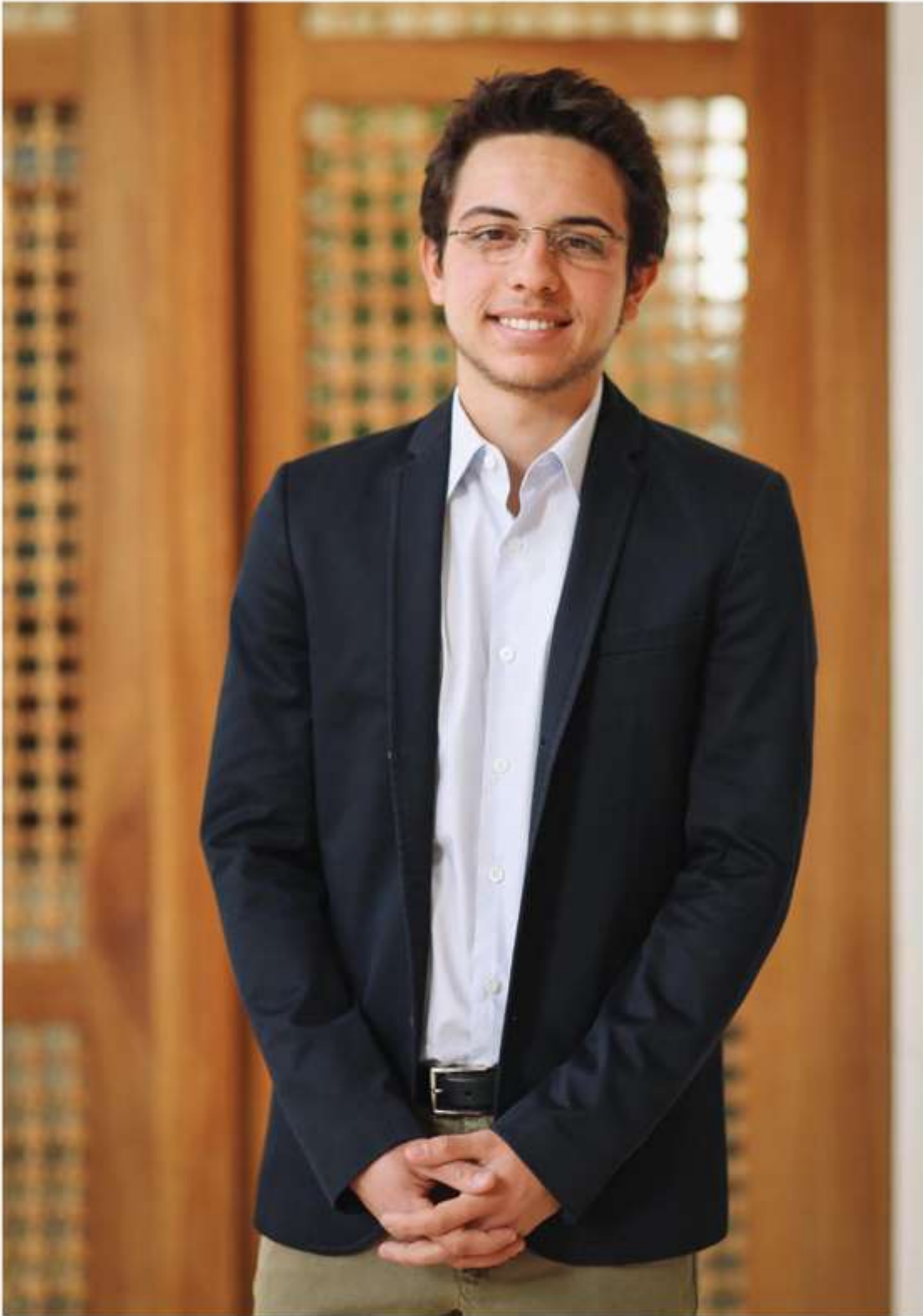
صاحب السمو الملكي الأمير الحسين بن عبد الله الثاني ولي عهد ملك المملكة الأردنية الهاشمية