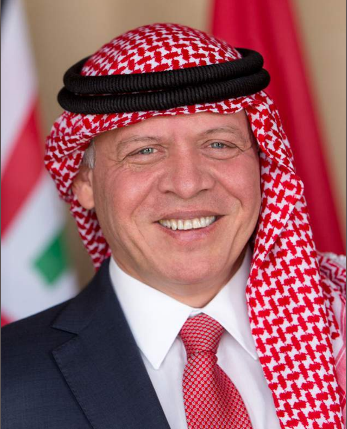
حضرة صاحب الجلالة الملك عبدالله الثاني ابن الحسين المعظم