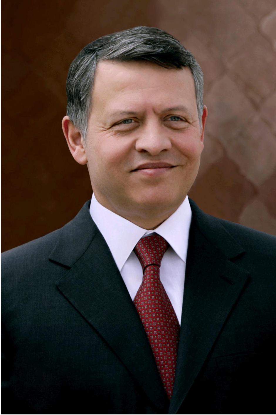
حضرة صاحب الجلالة الهاشمية الملك عبد الله الثاني ابن الحسين المعظم