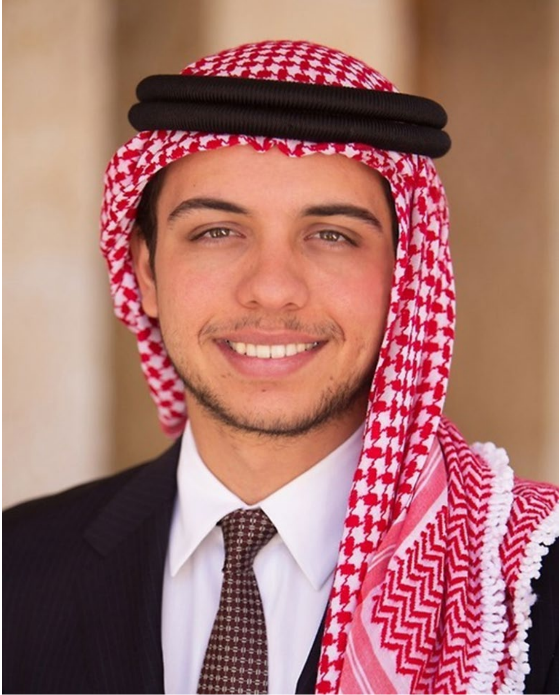
ولي العهد سمو الأمير الحسين بن عبد الله الثاني المعظم