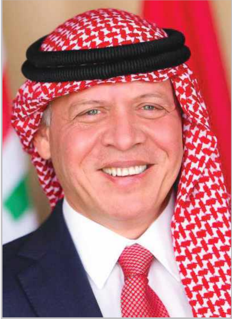
حضرة صاحب الجلالة الملك عبد الله الثاني بن الحسين المعظم