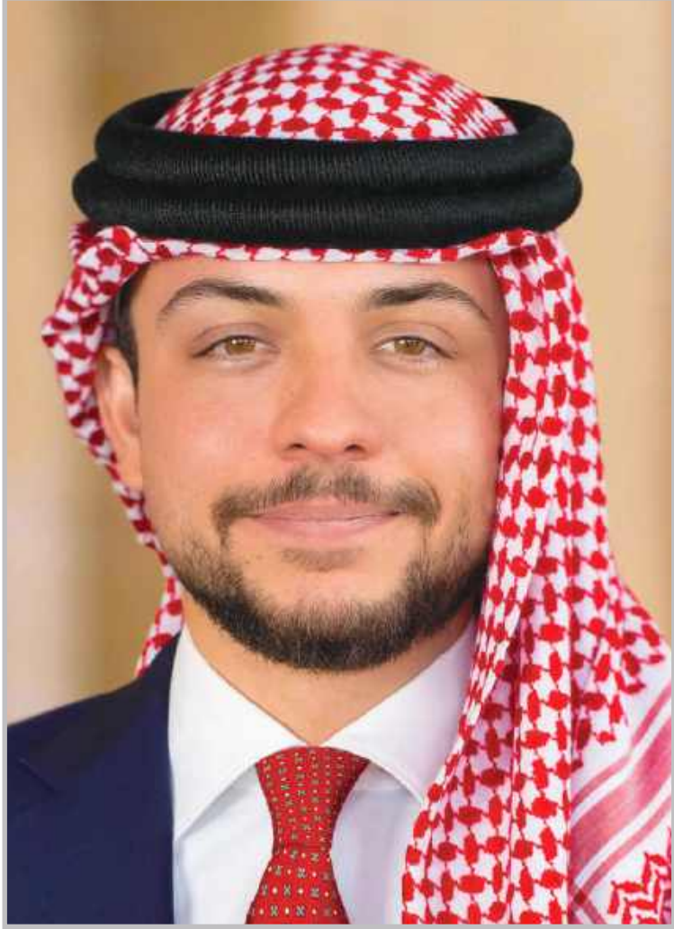
الأمير حفرة صاأب السمو الملكي الحسين بن عبد الله الثاني ولي العهد المعظم